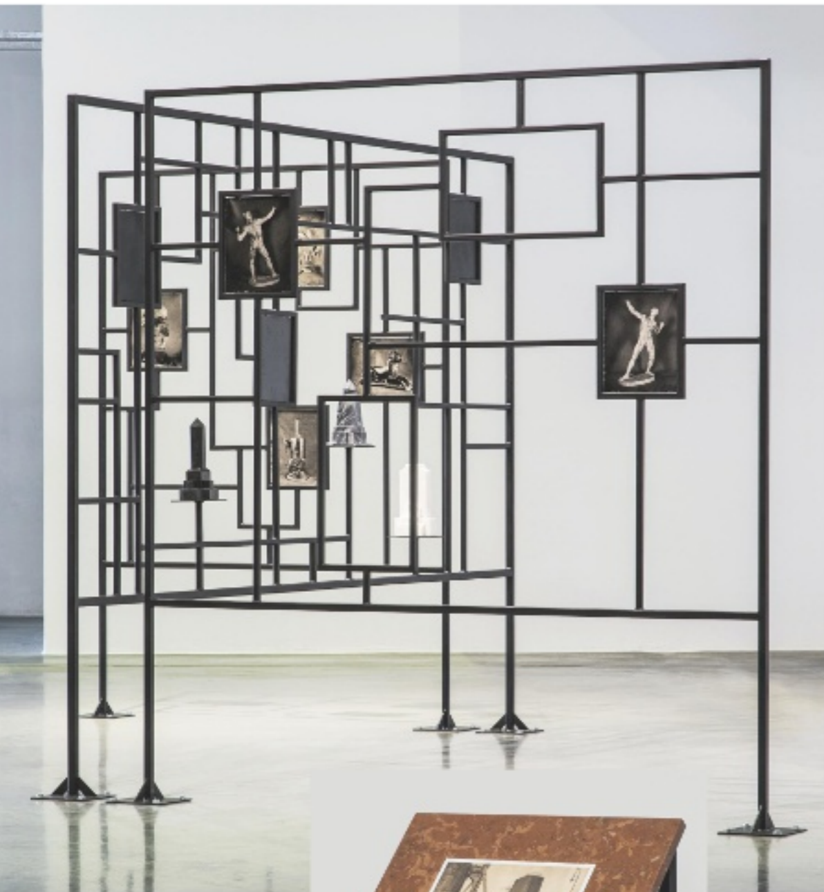
< Ein Raumteiler mit Fenstern in die ungarische Vergangenheit RAUMTEILER I-III, 2017