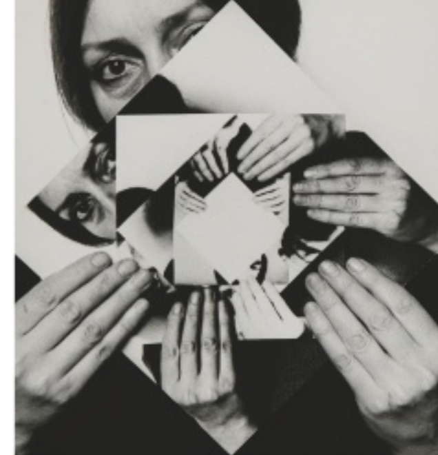
< Frühes Werk von Dóra Maurer: mit konzeptueller Fotografie schöpfte sie den Spielraum des Individuums in sozialistisch-konformen Zeiten aus BILD AUS DER SERIE SEVEN TWISTS, 1979

Ein geradezu ironischer Vorschlag, angesichts der staatsseitig propagierten Europa-Feindlichkeit, findet Albert. Während er sich als Lehrkraft in das friedliche Reich der Tradition zurückziehen darf, kann er als Künstler die Augen nicht vor dem bedrückenden Klima verschließen. Vor einigen Jahren noch gestaltete er surreale Rauminstallationen, handwerklich und ästhetisch auf hohem Niveau,