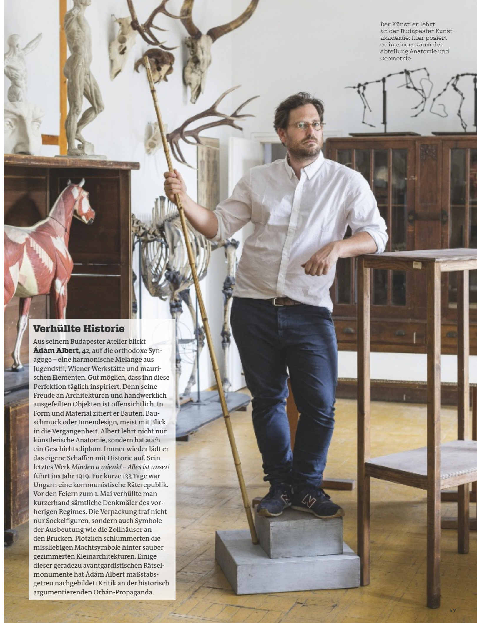
Der Künstler lehrt an der Budapester Kunstakademie: Hier posiert er in einem Raum der Abteilung Anatomie und Geometrie

Die staatliche Leugnung der Vergangenheit ist sein Thema