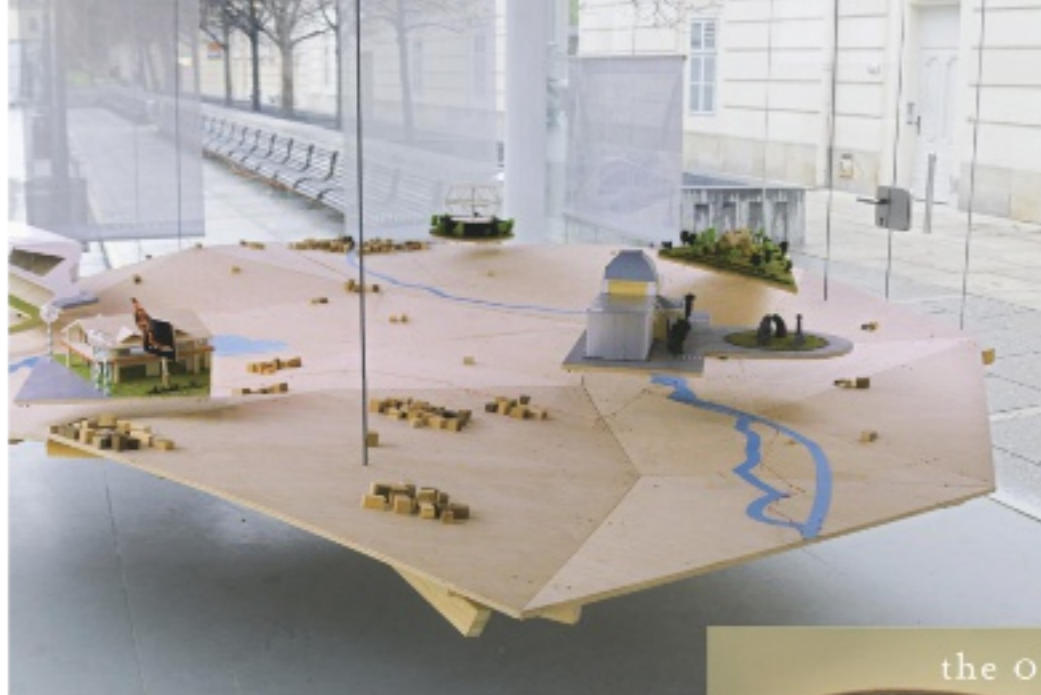
<v Als Teil des Künstlerkollektivs Polygon Creative Empire war Bajusz an einer Installation beteiligt, die skulptural (links) und in Animationen (unten) ein fiktives Investorenprojekt vorstellte: das »Sissi Quartier« zwischen Wien, Bratislava und Győr SISSI QUARTIER IM WIENER MUSEUMS-QUARTIER, 2017