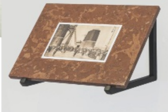
DETAILS AUS »MINDEN A MIENK!« – »ALLES IST UNSER!«, 2018